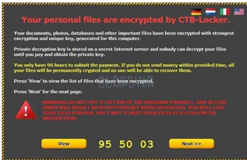
Figura 1. Mesaj afișat utilizatorilor în urma infecției cu CTB Locker

Pentru mai multe informații referitoare la această amenințare vă recomandăm parcurgerea articolului dedicat CTB Locker pe portalul CERT-RO: https://cert.ro/citeste/ransomware-ul-ctb-locker